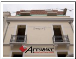
Ανακατασκευή Νεοκλασικού Ανακατασκευές Οκτ '10