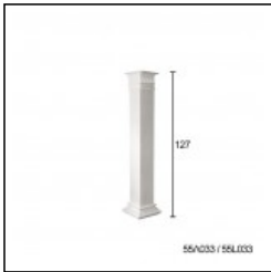
Αμερικάνου 4 Κολώνες Cat.No.